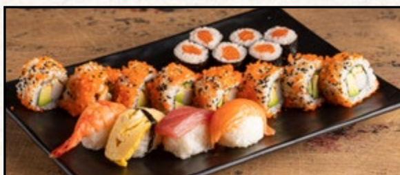
MENÜ 5 19,90

4 Stk. Nigiri (1 Ebi, 2 Sake, 1 Surimi) 6 Stk. Sake Maki, 6 Stk. Avocado Maki, 4 Stk. Ebi Tempura Roll