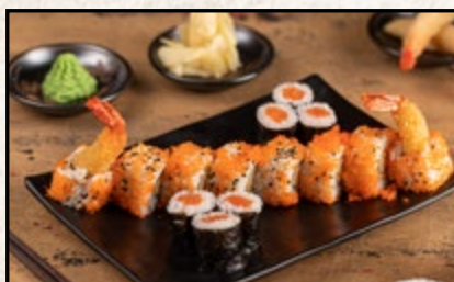
MENÜ 2 15,90

6 Stk. Sake Maki, 6 Stk. Avocado Maki 8 Stk. California I.O