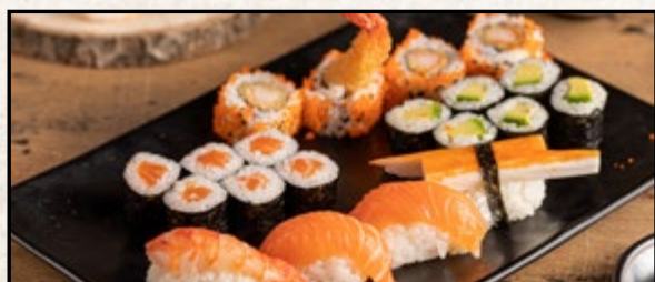
MENÜ 4 20,90

2 Stk. Sake Nigiri, 6 Stk. Sake Maki 8 Stk. California I.O