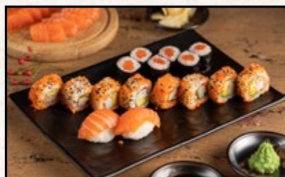
MENÜ 3 15,90

6 Stk. Sake Maki, 8 Stk. Ebi Tempura Roll