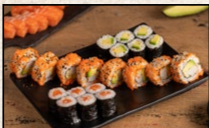
MENÜ 1 14,90

6 Stk. Sake Maki, 6 Stk. Avocado Maki 8 Stk. California I.O